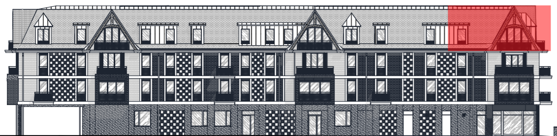
FACADE NORD - Echelle : 1/400ème