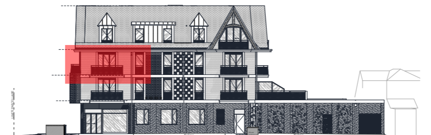
FACADE OUEST - Echelle : 1/400ème