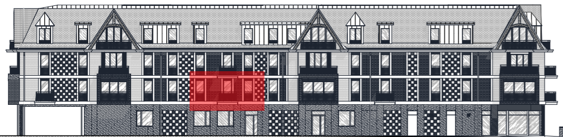
FACADE NORD - Echelle : 1/400ème