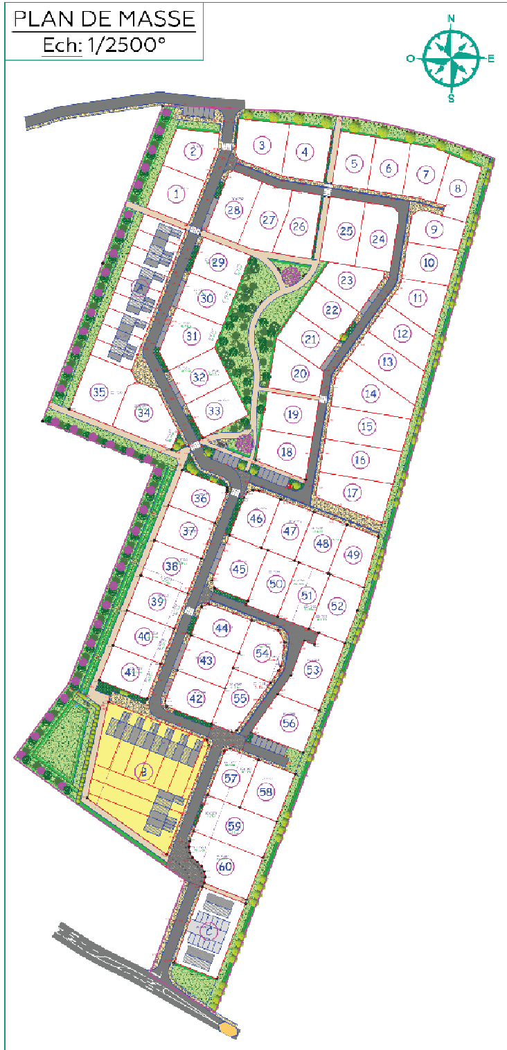
PLAN DE MASSE Ech: 1/2500°