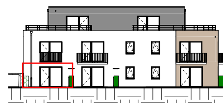
Façade Ouest- 1/400